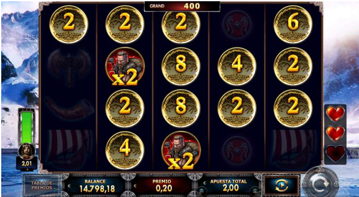
TABLA DE PREMIOS