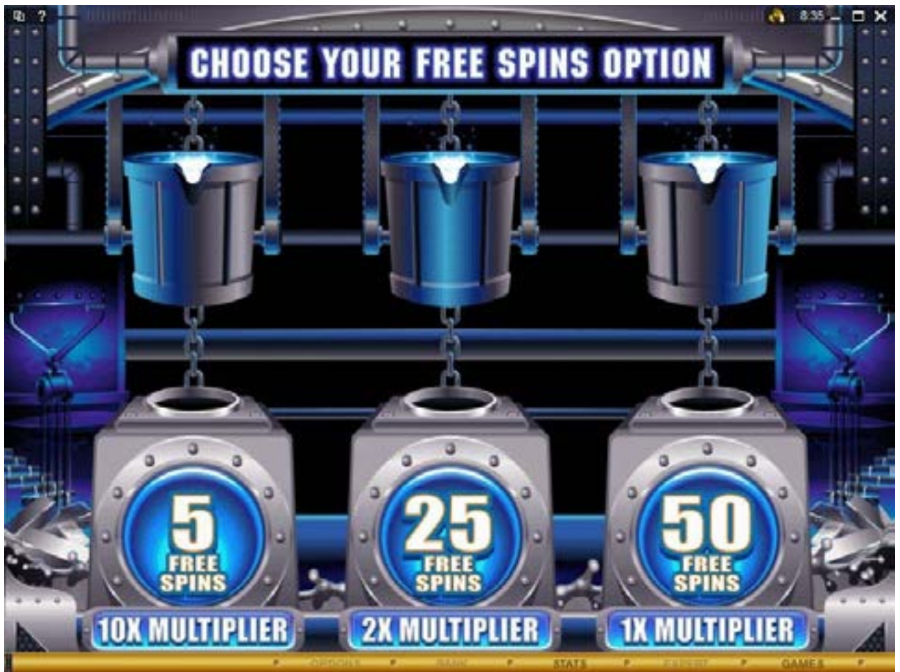
Figura 2: Pantalla de selección de tiradas gratis