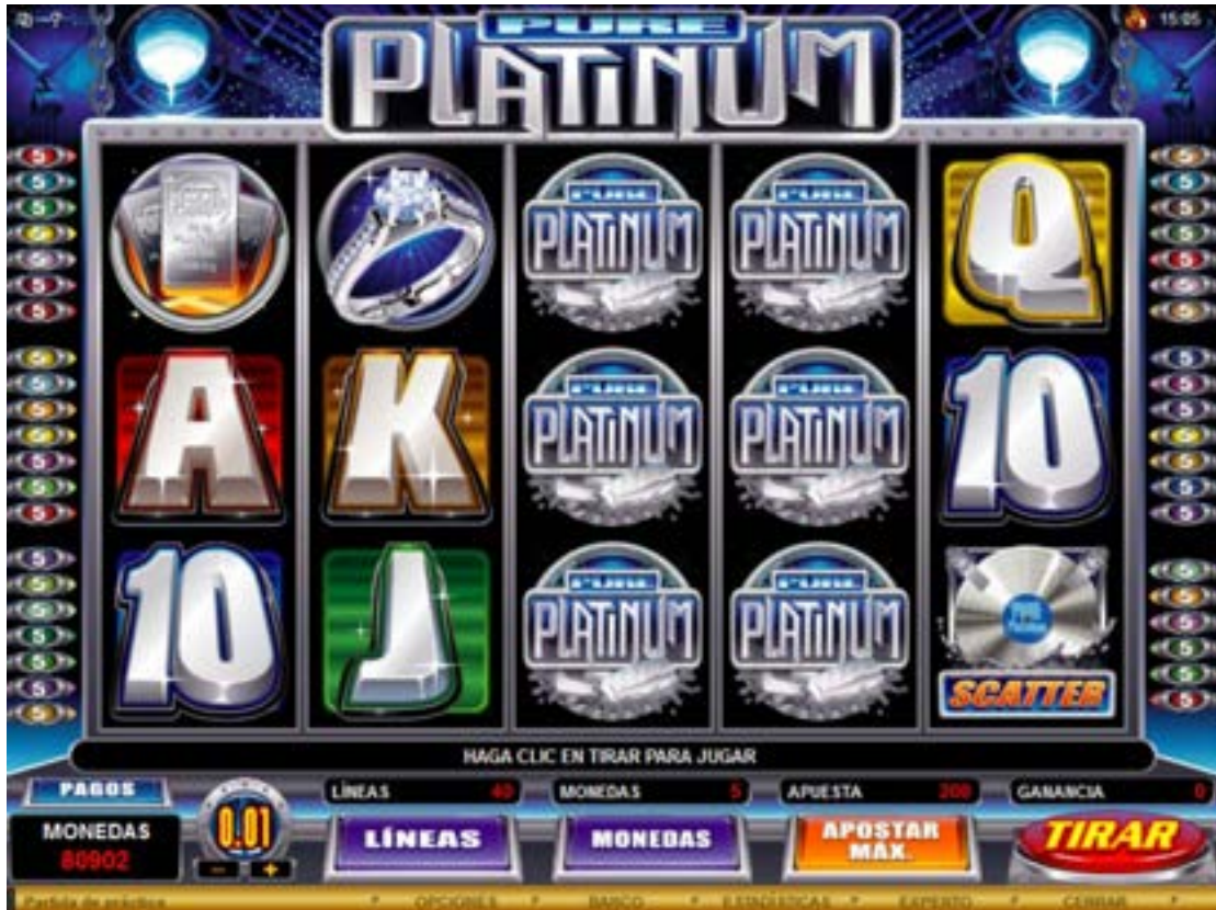
Figura 1: Juego base