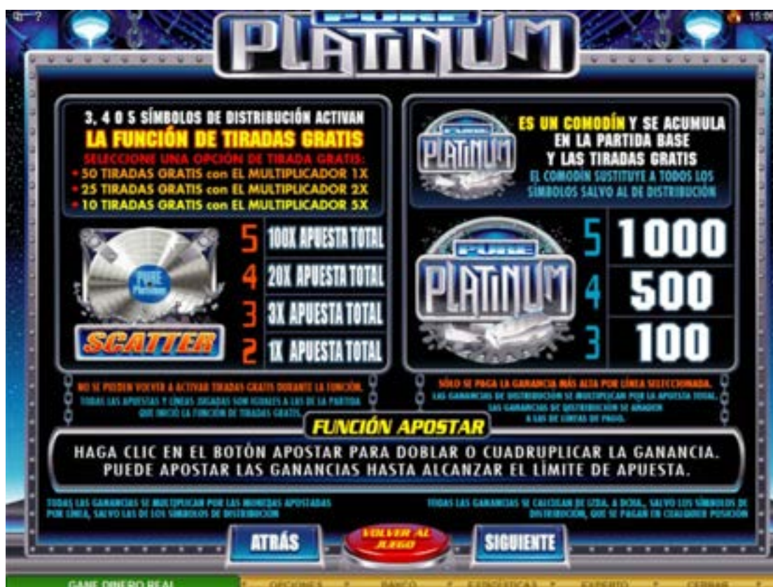
Tabla de premios 1