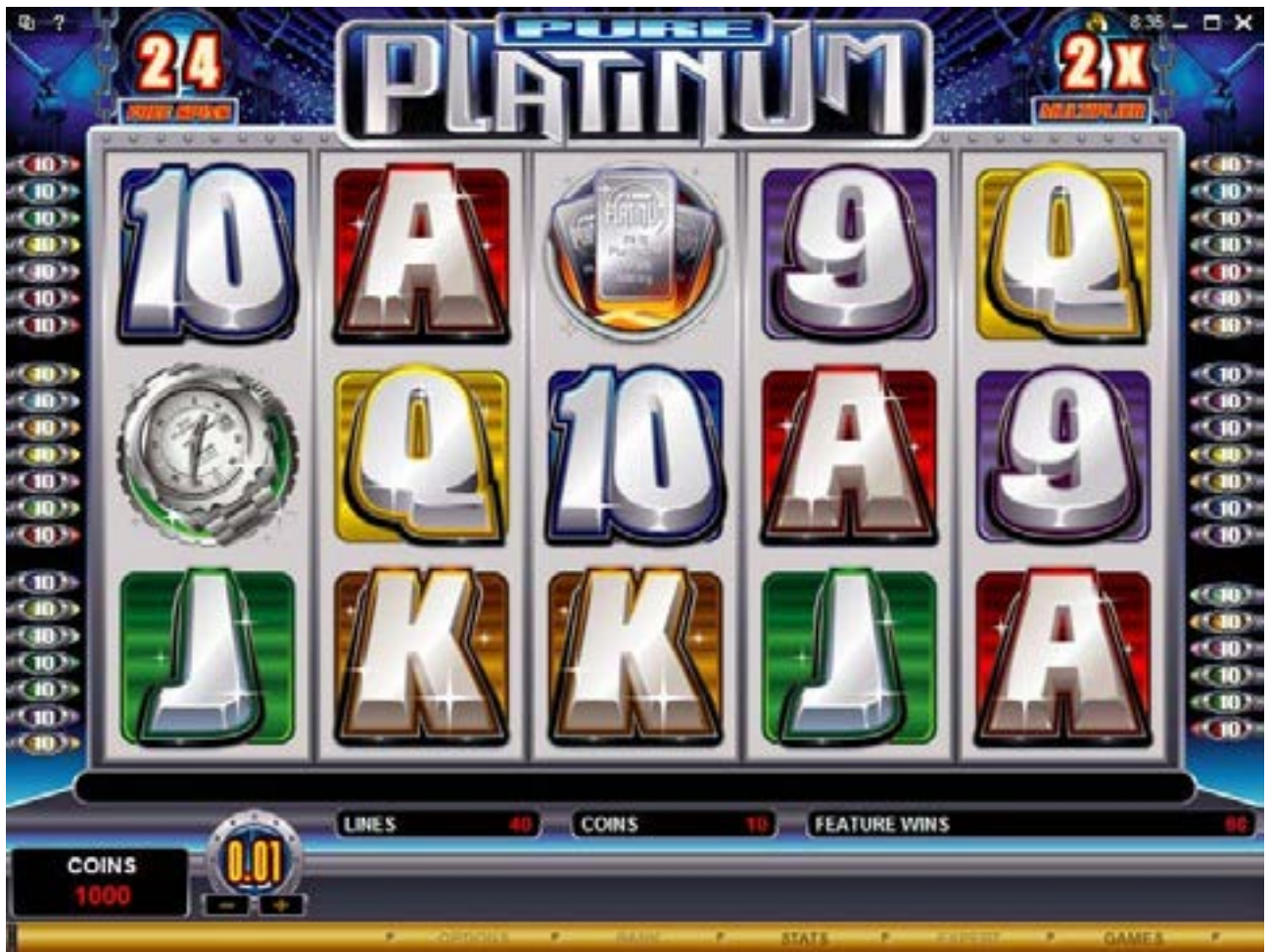
Figura 1: Pantalla de tiradas gratis