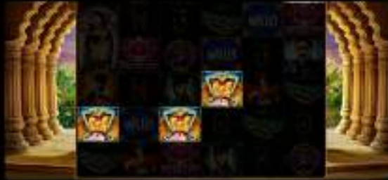
TABLA DE PREMIOS X

Dale al botón de jugar en el centro de la ruleta de los espías para ganar premios y multiplicadores.