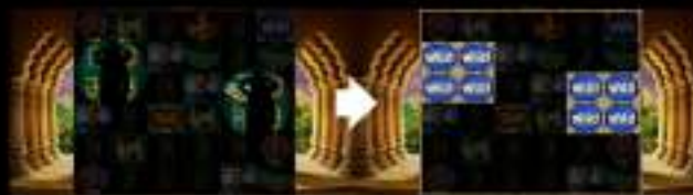
TABLA DE PREMIOS

Los símbolos que estén debajo de los focos se convertirán a símbolos WILD, tras lo cual se concederán premios si los hubiera.