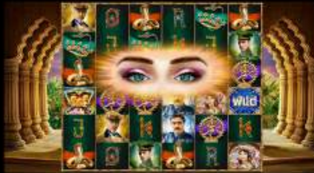
TABLA DE PREMIOS

Los símbolos que estén debajo de los focos se convertirán a símbolos WILD, tras lo cual se concederán premios si los hubiera.