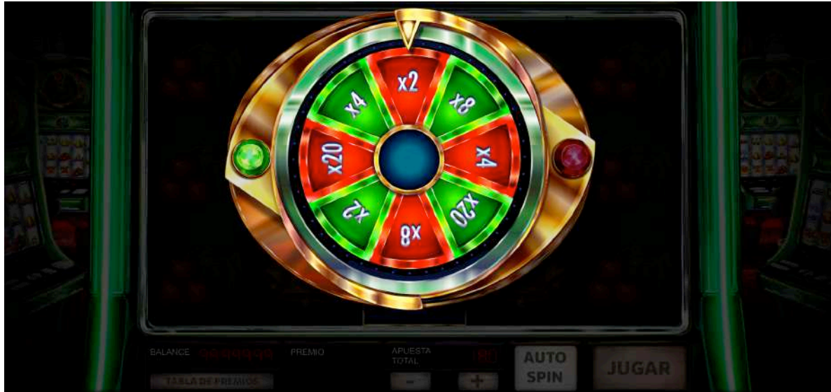
Tabla de premios